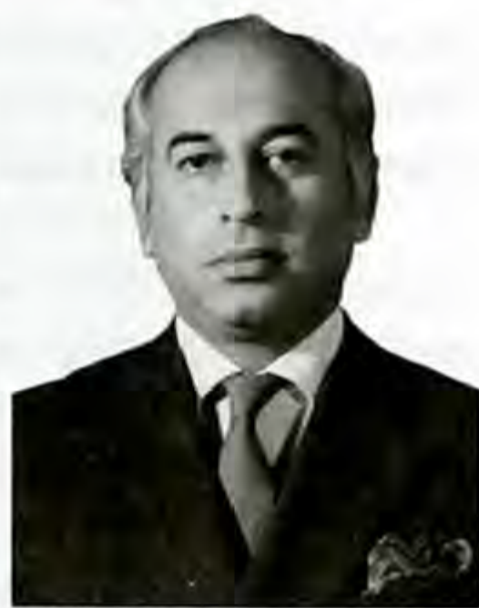
Зульфикар Али Бхутто.

Пакистанда — Пакистан элинин партиясы , жетекчиси Зульфикар Али Бхутто . «Авами лиг» партиясынын жетекчилиги бийликти Улуттук ассамблеяга өткөрүп берүүнү жана Чыгыш Пакистандын региондук автономиясын конституциялык таанууну талап кылган. Пакистандын башкаруу чөйрөсүнүн калктын басымдуу бөлүгүнүн эркин билдирген бул талаптарды аткаруудан баш тартуусу эң курч саясий кризиске алып келген. Чыгыш Пакистан элинин аскердик диктатуранын тартибине каршы куралдуу күрөшүнүн натыйжасында Бангладеш Элдик Республикасы түзүлгөн. Даккадагы пакистандык аскерлер 1971-ж. 16-декабрда капитуляцияланган. Эки күндөн кийин батыштагы согуштук аракеттер да токтогон. Ошентип, 1971-ж. 20-декабрда генерал А. М. Яхья хан бийликти З. А. Бхуттого өткөрүп берип, өзү отставкага кеткен.