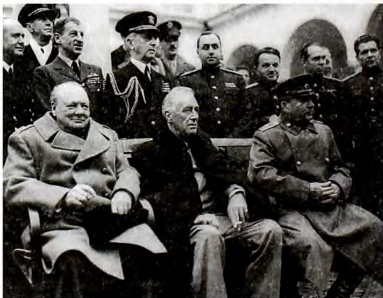
Тегеран конференциясынын учурунда. У. Черчилль, Ф. Рузвельт, И. Сталин.

Тегеран конференциясы. 1943-ж. аягындагы согуштук кырдаал союздаштардан 1944-ж. согуш пландарын тактоону талап кылган. Бул маселелер Тегеран конференциясында антигитлердик коалициянын негизги үч мамлекетинин башчылары – Франклин Рузвельт, Иосиф Сталин жана Уинстон Черчиллдин катышуусу менен каралды. Конференциянын негизги маселелеринин