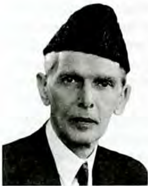
Мухаммад Али Жинна.

колониячылар Түштүк Азиядан чыгып кетүүгө мажбур болушат. Ошентип, Британиялык Индиянын ордуна эки доминион — Индия Союзу жана Пакистан пайда болгон. Пакистандын тунгуч генерал-губернатору Мусулман лигасынын лидери жана Пакистан мамлекетин түзүү кыймылынын жетекчиси Мухаммад Али Жинна (1876–1948) болгон.