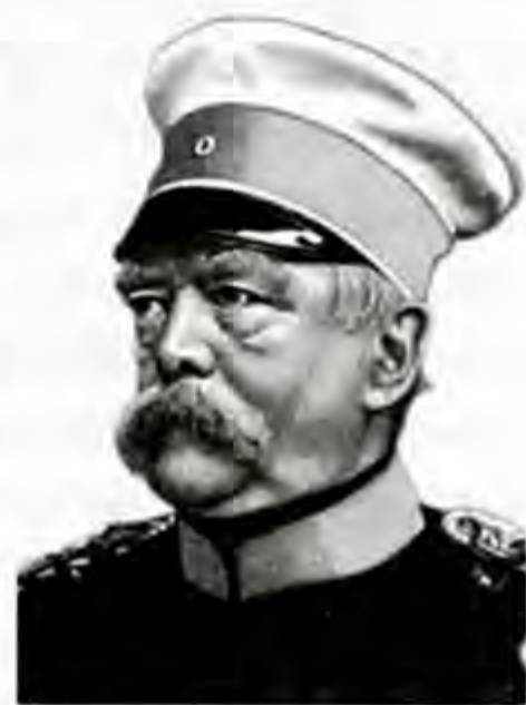
Отто фон Бисмарк (1815–1898).

Эки жылга созулган согуштардан кийин түзүлгөн 1866-ж. 24-августтагы Париж тынчтык келишиминин шарты боюнча, Австрия Германияга гегемондук кылуу ниетинен баш тартат, Гольштейн менен Шлезвигдин Пруссияга өткөрүлүшүнө макул болот да, Германия союзунан чыгарылат. Германия союзунун ордуна Түндүк Германия союзу түзүлүп, ага Майн дарыясынын