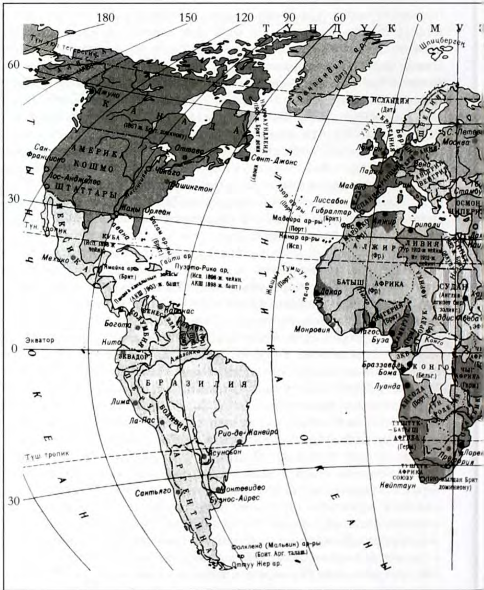
Дүйнөнүн саясий картасы. XX к. 30-жж. экинчи жарымы.