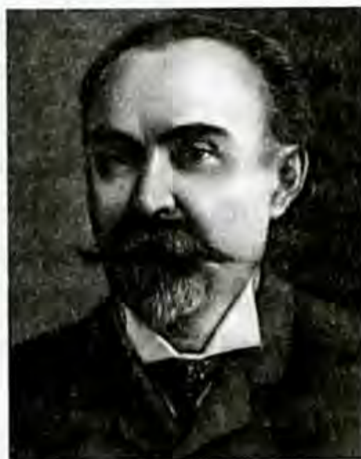
Г. В. Плеханов.