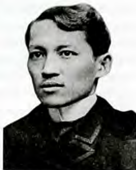
Хосе Рисаль. (1861–1896)

Ошол эле мезгилде өкмөт социалдык-экономикалык кайра куруулардын кеңири программасын ишке ашырууга киришкен. Негизин агрардык реформа түзгөн бул программанын башкы 6 милдети болгон: жумуштуулукту кеңейтүү, экономикалык өсүш темпин жогорулатуу, кирешелерди калктын ар кайсы топторуна мүмкүн болушунча бирдей бөлүштүрүү, четки аймак-